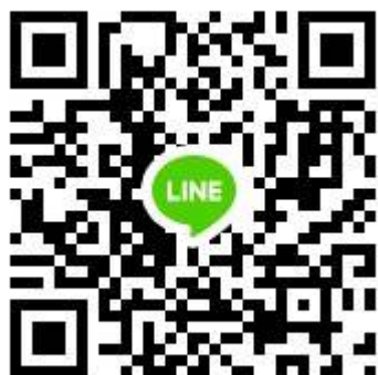
QR Code Group